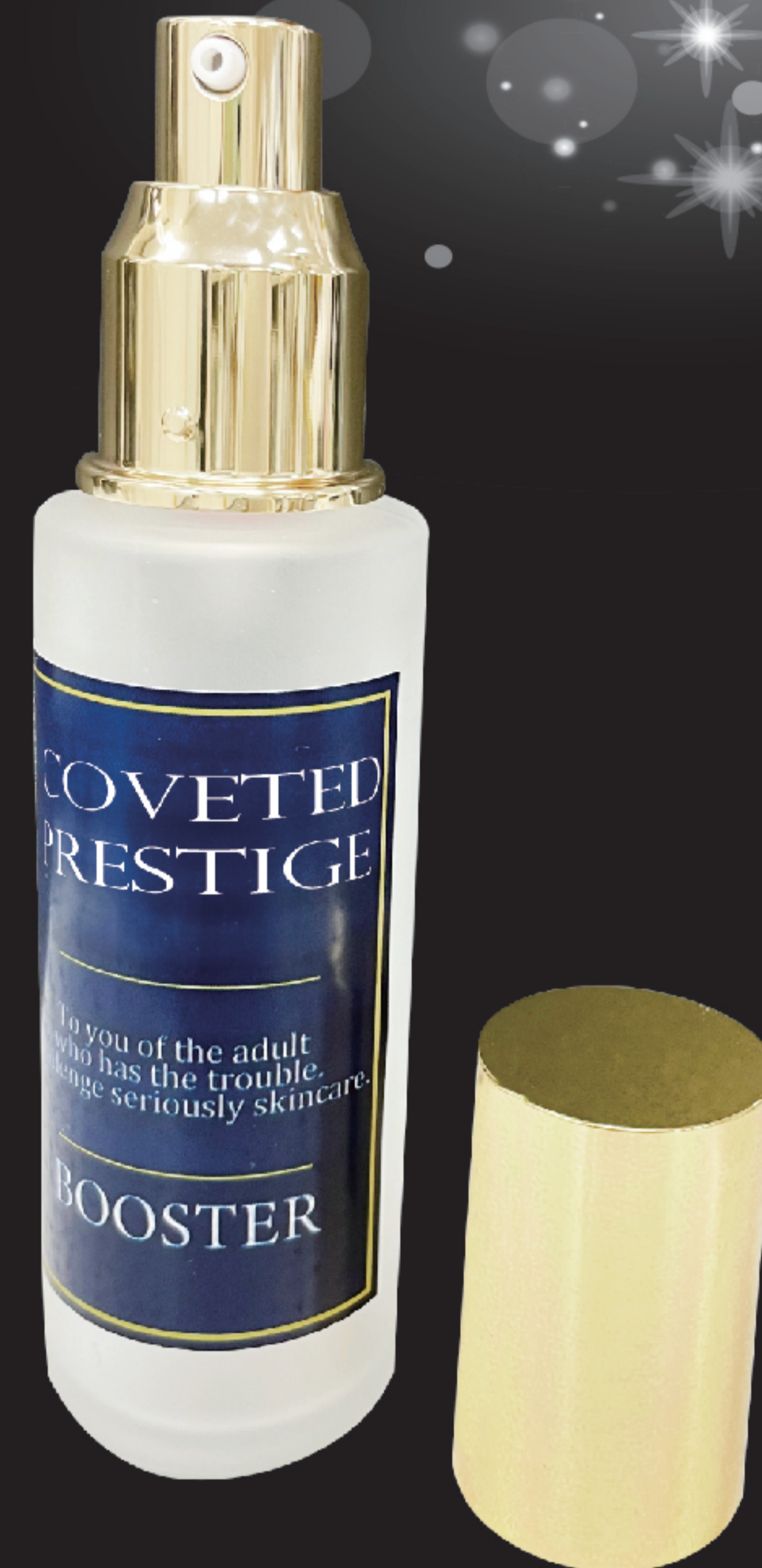
憧れのプレステージ ブースター